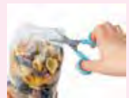
調理バサミとの使い分けができて便利!